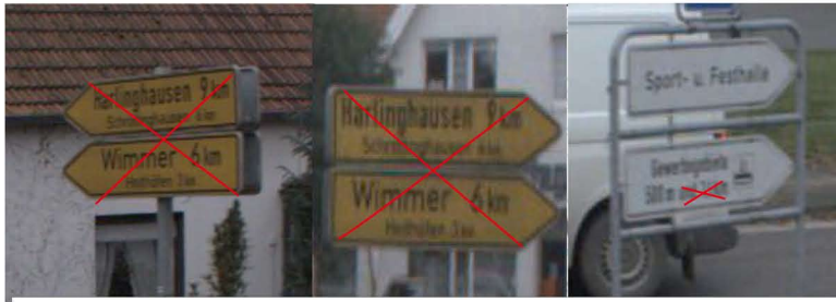
Beschilderung KP L767-L766 in Levern Auskreuzen mit mobiler Auskreuzeinrichtung, Gewerbegebiet 1,5km auskreuzen